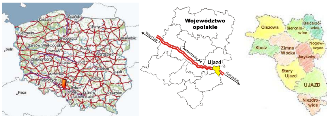
Rysunek 1 Położenie miejscowości Stary Ujazd

Gmina Ujazd leży w powiecie strzeleckim. Zgodnie z Uchwałą Nr VIII/34/2003 Rady Miejskiej w Ujeździe z dnia 25 marca 2003 r. w sprawie uchwalenia Statutu Gminy Ujazd – gmina obejmuje miasto Ujazd wraz z osiedlem Goj oraz terytoria sołectw: