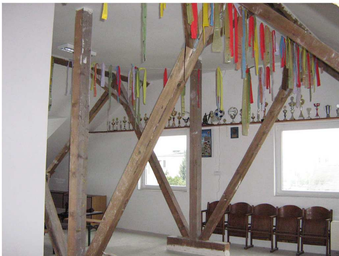
Rysunek 6 Świetlica wiejska – stan istniejący