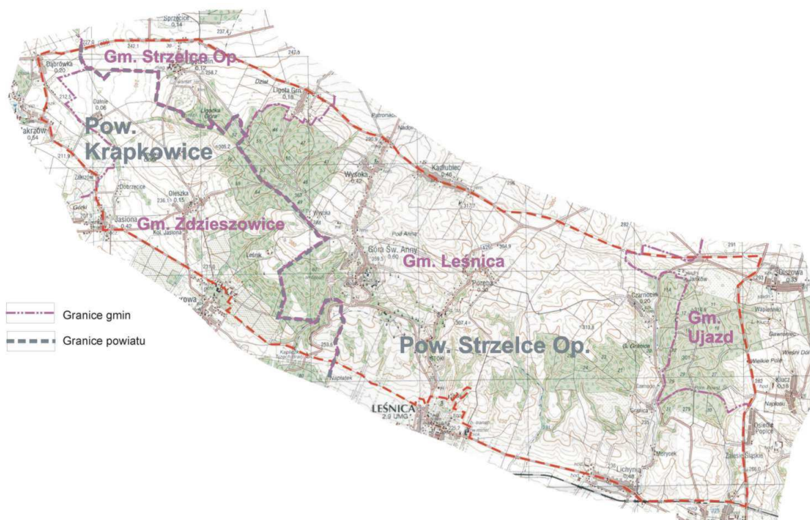
Ryc. 1. Lokalizacja PK Góra św. Anny a gmina Ujazd.

W granicach gminy Ujazd znajduje się około 2% powierzchni Parku Krajobrazowego Góra Św. Anny, obejmującego zachodnią część gminy. Flora parku jest urozmaicona, ale niezbyt bogata, istnieje tam około 400 gatunków roślin naczyniowych, z czego 20 jest objętych ochroną. Pod względem występowania gatunków zwierząt (zwłaszcza większych) obszar parku nie wyróżnia się od terenów prawobrzeżnej Opolszczyzny.