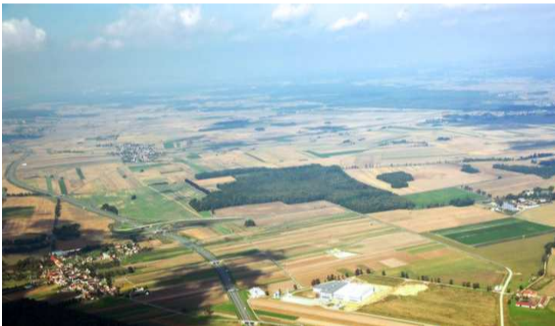
Rysunek 3 Gmina Ujazd z lotu ptaka

Flora Parku Krajobrazowego Góra Św. Anny jest urozmaicona, ale niezbyt bogata, istnieje tam około 400 gatunków roślin naczyniowych, z czego 20 jest objętych ochroną.