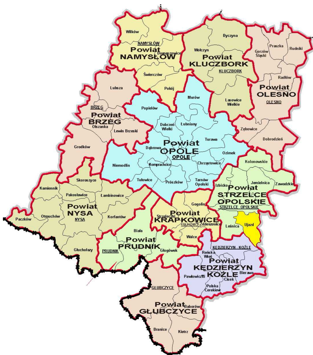
Rysunek 2 Gmina Ujazd na tle administracyjnym województwa opolskiego